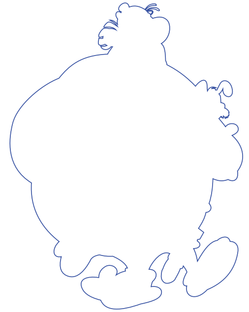
Snijlijn aangegeven Steunkleur "Thru-cut" in aparte laag "Snijlijn"