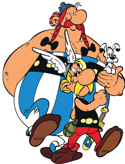
Transparant met wit, kleuren zijn duidelijk door een witte onderlaag. Hierdoor is de sticker op een donkere ondergrond ook goed zichtbaar.